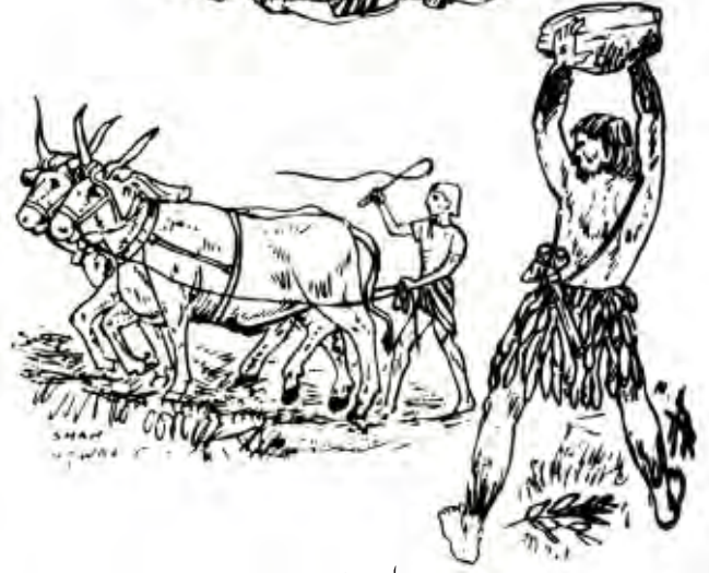
پہلے دا انسان